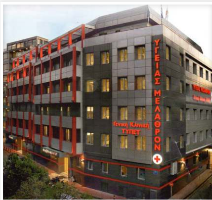
Ανακαίνιση Υγείας Μέλαθρον

“Παρουσιάζουμε στους ασφαλισμένους τα πεπραγμένα της Διοίκησης του ΤΥΠΕΤ το 2019”