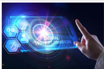
Ψηφιοποίηση στο ΤΥΠΕΤ

“Για πρώτη φορά ηλεκτρονική διαχείριση της διαδικασίας συμμετοχής στις κατασκηνώσεις”